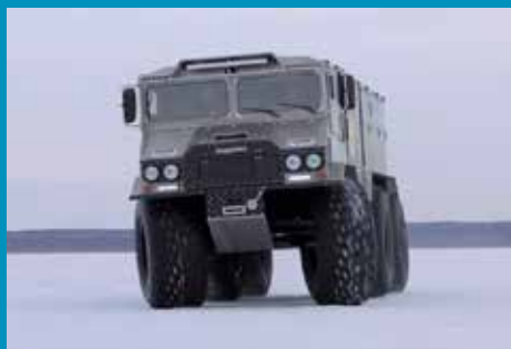
Наземные испытания 240 000 просмотров на youtube