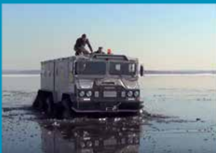
Испытания на воде 180 000 просмотров на youtube