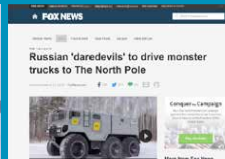
Публикации в электронных СМИ и ТВ-сюжеты

Компании-партнеры являются полноправными участниками информационной среды проекта.